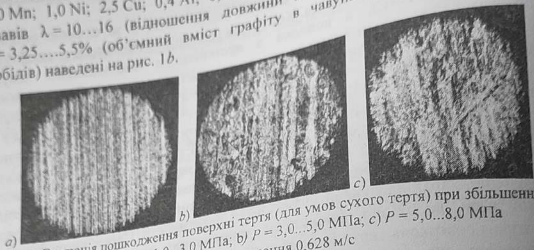
Рис. 2. Еволюція пошкодження поверхні тертя (для умов сухого тертя) при збільшенні навантаження а) P = 1,0...3,0 МПа; б) P = 3,0...5,0 МПа; в) P = 5,0...8,0 МПа та швидкості ковзання 0,628 м/с

Базовий хімічний склад (БХС) чавунів становив (мас. %): 3,4...3,7 C; 3,0 Si; 12,0 Mn; 1,0 Ni; 2,5 Cu; 0,4 Al; 0,1 P; 0,02 S. Параметри мікроструктури для сплавів \lambda = 10...16 (відношення довжини до ширини включень графіту); V_g = 3,25...5,5\% (об'ємний вміст графіту в чавунах); S_g = 7...23\% (площа карбідів) наведені на рис. 1b.